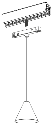
Рис. 2. Установка светильника